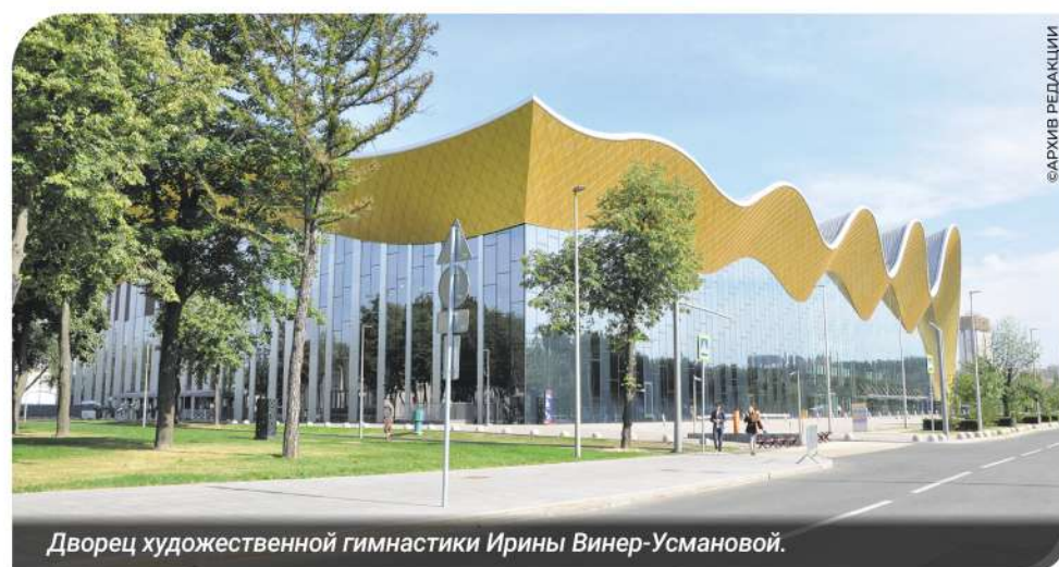
Дворец художественной гимнастики Ирины Винер-Усмановой.

— Если брать цифры за последние пять лет, то с 2018 по 2023 год комплексно благоустроены территории 13 жилых кварталов, 93 дворов, 10 образовательных учреждений, в том числе дошкольных, и 10 дворовых спортплощадок.