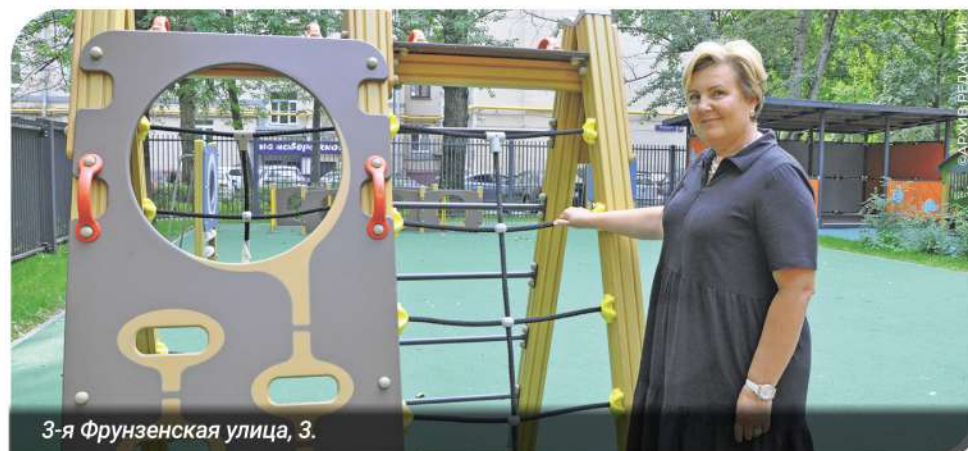
3-я Фрунзенская улица, 3.