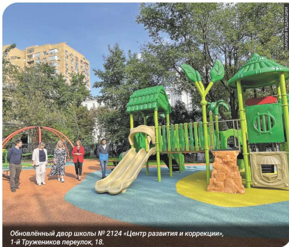
Обновлённый двор школы № 2124 «Центр развития и коррекции», 1-й Тружеников переулок, 18.

После реставрации открыта школа № 1529 им. А.С. Грибоедова в Староконюшенном переулке, дом 18 — это здание является объектом культурного наследия Москвы.