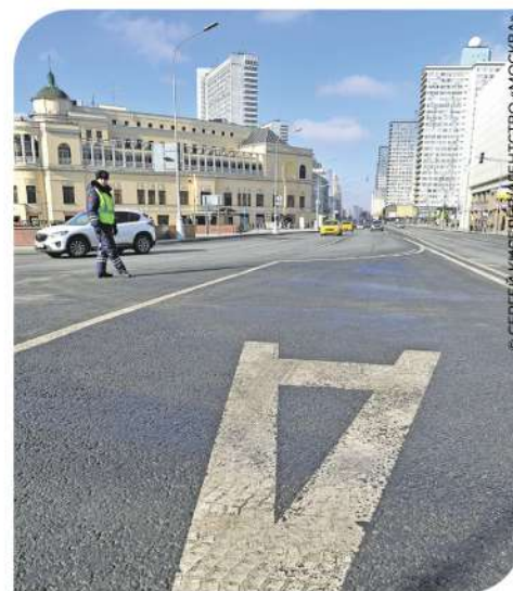
общественный транспорт, более комфортными и, что самое важное, позволяют лучше рассчитать время.

В последние 10 лет транспортная система Москвы развивается бурными темпами: новыми станциями и даже линиями прирастает метро, появляются новые виды передвижения (по МЦК, МЦД), прокладываются новые магистрали, проведена реформа наземного транспорта. Выделенные полосы встраиваются в эту логику, поскольку делают поездки для тех, кто предпочитает